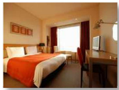
シティダブルルーム