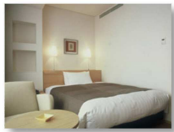
シティシングルルーム